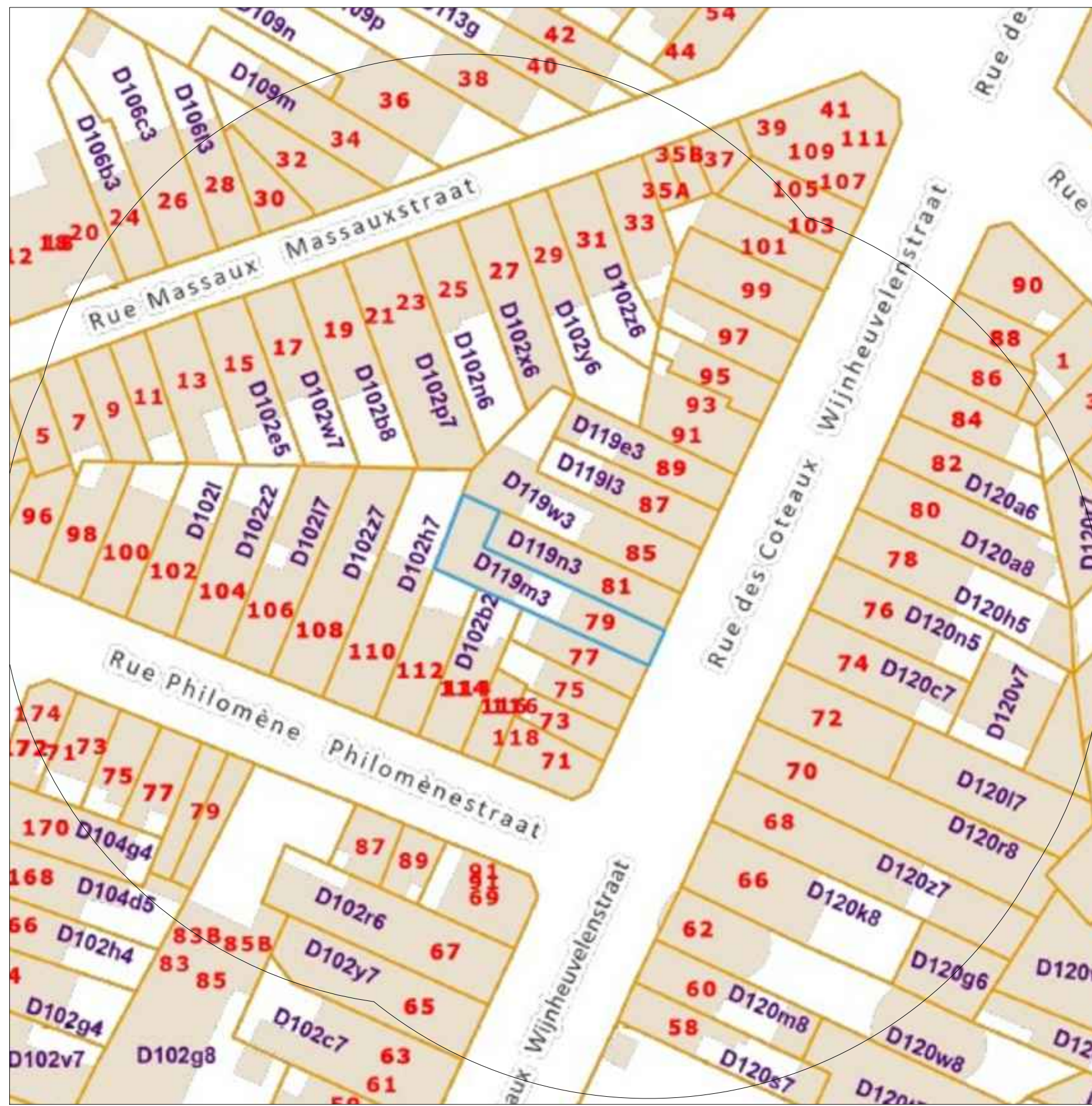
PLAN DE SITUATION ECH 1/500